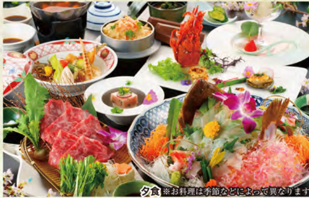
夕食 ※お料理は季節などによって異なります

新鮮な有明海の海の幸と島原半島の豊かな土壌が育んだ 栄養たっぷりのシャキシャキ野菜を中心に料理長自ら厳選した 旬素材をヘルシーな京風味に仕上げます。