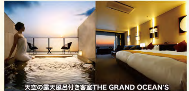
天空の露天風呂付き客室THE GRAND OCEAN'S