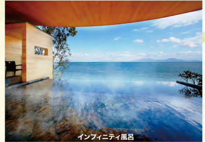
インフィニティ風呂